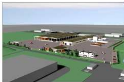
Impianto di produzione compost

La realizzazione delle discariche controllate per rifiuti non pericolosi viene in genere completata con il recupero del biogas attraverso la cogenerazione e il trattamento in loco del percolato mediante la tecnologia dell' addensamento o mediante l'uso di processi chimico-fisici.