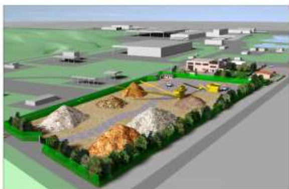
Area trattamento e riciclaggio inertii

L'attività riguarda la progettazione, la direzione lavori, il collaudo di opere pubbliche e private, la consulenza in campo ambientale e impiantistico, il supporto alla gestione degli impianti.