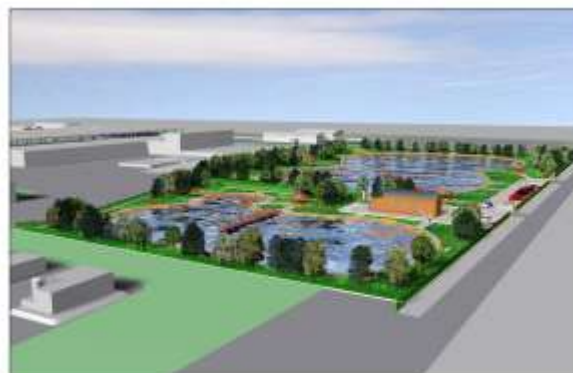
Area basini di lavinazione